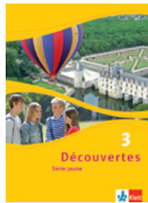
Découvertes, Série jaune, Band 3 (622031)