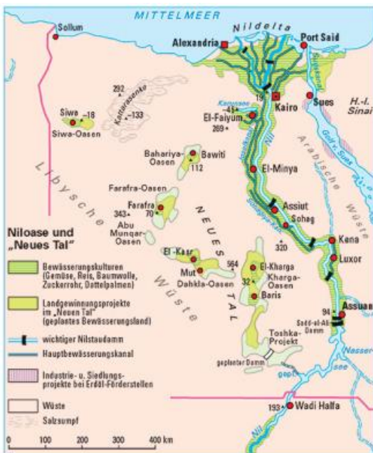
Niloase und Toshkaprojekt (Klett)

Schon seit einigen Jahren führt der Nil überdurchschnittlich viel Wasser und um ein Überlaufen des Nassersees zu verhindern, musste seit 1996 das Nilwasser während der Hochflut in die Toshka-Senke abgeleitet werden, das dann dort ungenutzt verdunstete. Diese unrentable Wassernutzung war 1997 der Auslöser für das Erschließungsprojekt. Anfang 2003 wurden die ersten Großpumpen in Betrieb genommen. Sie befördern das Wasser aus dem Stausee bis zu 50 m hoch in das Kanalsystem auf dem Hochplateau, das sich mehr als 320 km durch die Wüste schlängelt. Einige Flächen werden bereits landwirtschaftlich bewirtschaftet, während andere Gebiete noch vorbereitet werden. Täglich sollen sich einmal bis zu 25 Millionen m 3 Wasser in die Kanäle ergießen. Doch aufgrund der extremen klimatischen Bedingungen benötigt das Toshka-Projekt, trotz des Einsatzes modernster wassersparender Bewässerungstechniken, etwa zehn Prozent des für Ägypten verfügbaren Nilwassers. Diese Wassermenge muss im bisherigen Verteilungssystem eingespart werden, da aufgrund des Nilwassernutzungsabkommens der Nilanrainer Ägypten nur eine begrenzte Menge des Nilwassers (55,5 Mrd. m 3 pro Jahr)